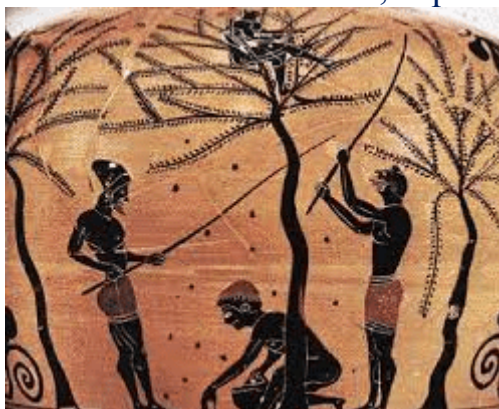
Древнегреческая ваза с изображением сбора оливок

В микенских дворцовых табличках, написанных линейным письмом Б, встречается термин «э-ра-во», означающий «масло», — одно из самых ранних письменных греческих слов. Дворцовые власти контролировали парфюмеров, которые варили травы в масле, чтобы создавать ценные мази, которыми торговала элита. Эта ранняя система связывала оливковое масло с богатством, торговлей и ремеслом.