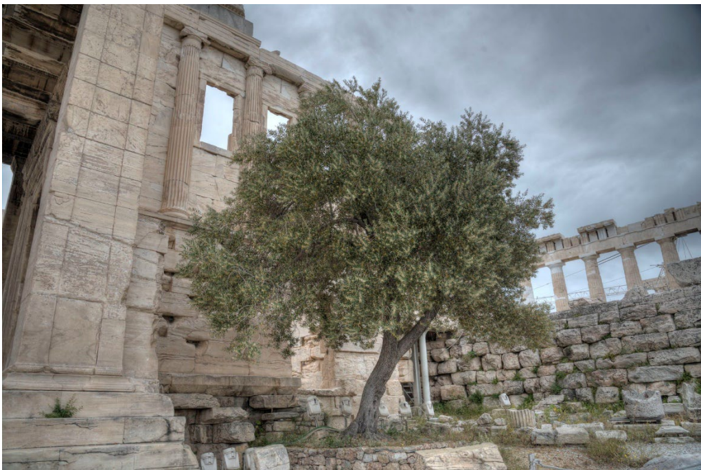
Ελιά στην Ακρόπολη.

Ελαιόλαδο έχει σχήμα αρχαίου Ελληνική μυθολογία ιστορία και φιλοσοφία για περισσότερα από 7.000 χρόνια, σύμφωνα με νέα έρευνα που δημοσιεύθηκε στο International Journal of Gastronomy και την Επιστήμη των Τροφίμων.