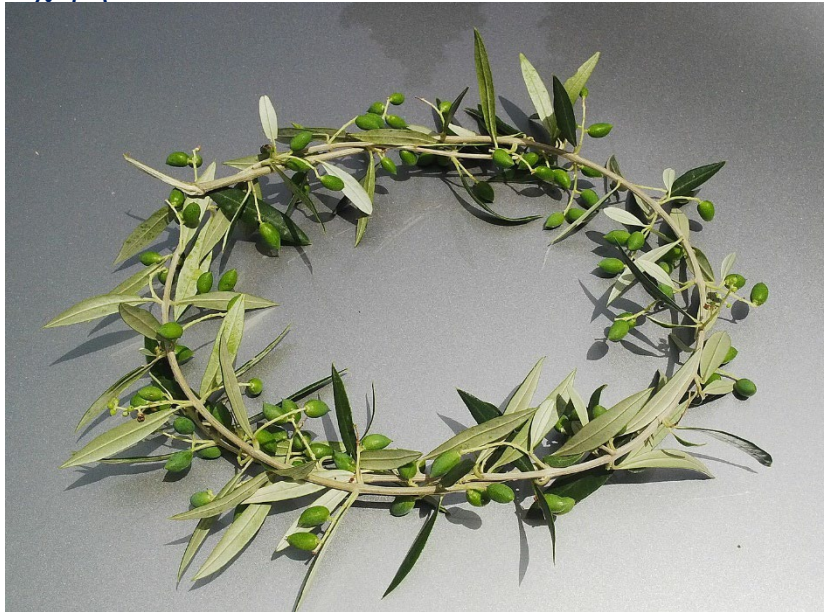
Στεφάνια ελιάς, το βραβείο για το νικητή των Αρχαίων Ολυμπιακών αγώνων.

Τελετουργίες και τα παιχνίδια ενισχυθεί η ελιά είναι το ιερό κατάσταση. Η ολυμπιακή και η Αθηναϊκή νικητές φορούσαν στεφάνια ελιάς (ελληνικά: κότινος) ως σύμβολα του θριάμβου και θεία χάρη.