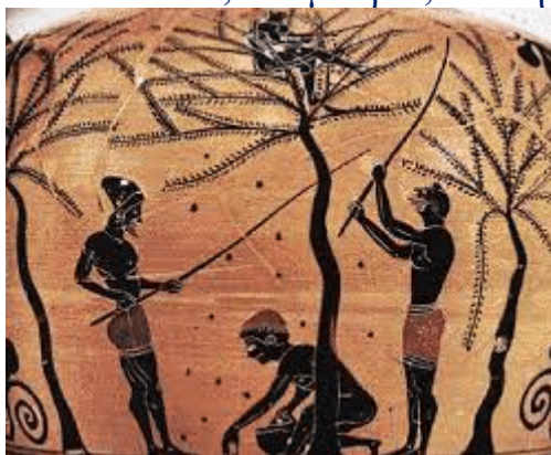
Αρχαίο ελληνικό αγγείο που απεικονίζει τις ελιές.

Μυκηναϊκό ανάκτορο δισκία γραμμένα σε Γραμμική Β καταγράφει ακόμα και ο όρος "e-ra-wo", που σημαίνει λάδι, μία από τις πρώτες γραπτές ελληνικές λέξεις. Palace αρχές ελεγχόμενη αρωματοποιούς που βρασμένα βότανα με λάδι για να δημιουργήσετε πολύτιμο αλοιφές, αντικείμενο διαπραγμάτευσης μεταξύ των ελίτ. Αυτό το πρώιμο σύστημα δεμένα ελαιόλαδο στον πλούτο, το εμπόριο, και τη χειροτεχνία.