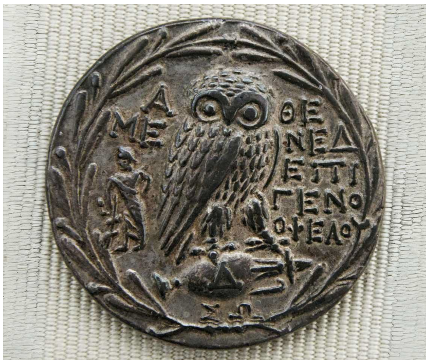
Афинская серебряная тетрадрахма (ок. 200–150 гг. до н. э.) с изображением совы и оливкового венка — символов богатства Афин и торговли оливковым маслом.

Писатели упоминали о священном дереве возле Эрехтейона, которое чудесным образом выросло заново после вторжения персов в 480 году до н. э. Защита дерева была закреплена законодательно: вырубка государственной оливковой рощи могла привести к суду и даже к смерти.