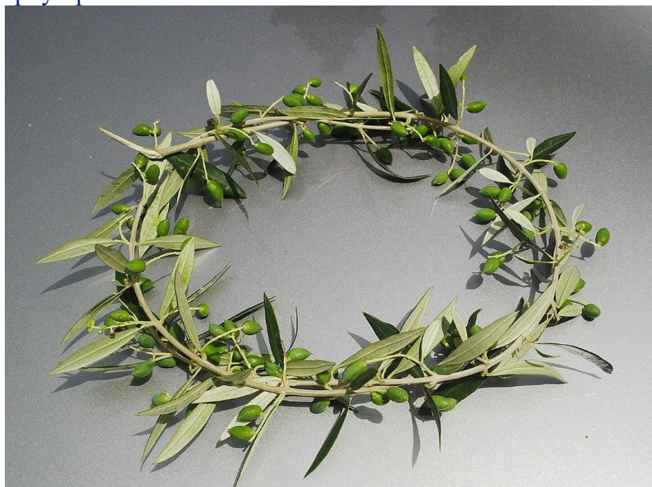
Оливковые венки — награда победителю древних Олимпийских игр.

Ритуалы и игры укрепляли священный статус оливкового дерева. Победители Олимпийских игр и аттические триерархи носили оливковые венки (греч. κότινος ) как символ триумфа и божественной милости.